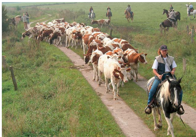
Auch in Nordfriesland nicht alltäglich – der Weideabtrieb zu Pferd vermittelt vom Maschinenring.

Das der Maschinenring in Nordfriesland für Service rund um das Rind steht, ist den Mitgliedern bekannt. Aber dass Westernreiter mit Hut, Pferd und Lasso Rinder von den Marschweiden treiben, muss man schon mit eigenen Augen gesehen haben.